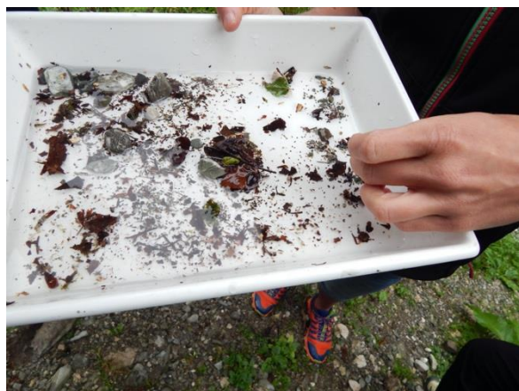
Slika 1: Ogled različnih vodnih nevretenčarjev v reki Ribnici nad pregrado v Srednji vasi pri Bohinju.

V lokalnem okolju prebivalcev občine Bohinj smo raziskovali in spoznavali vrstno pestrost štirih različnih urbanih okoljih, in sicer vodotokov (Slika 1), parkov, degradiranih območij (Slika 2) in gozdnih robov. Skozi interaktivne sprehode smo si ogledali lokalni preplet biotske pestrosti in človeka ter pozitivne in negativne posledice človeškega delovanja na lokalno biotsko pestrost. Na koncu delavnice smo se osredotočili predvsem na različne načine sonaravnega upravljanja urbanih površin, ki vodijo do večje biotske pestrosti in s tem do bolj zdravega okolja za človeka (Slika 3 in 4). Tekom delavnic smo predstavili številne rešitve za dejanske primere na vsaki lokaciji.