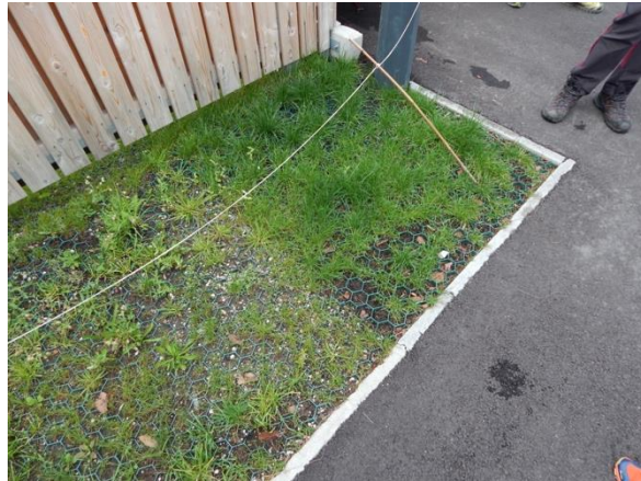
Slika 2: Oglede sonaravnih rešitev za povečanje vrstne pestrosti na parkiriščih in degradiranih območjih v Stari Fužini.