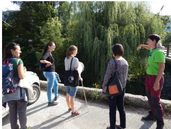
Slika 4: Oglede močno regulirane struge reke Belice in predstavitev potencialne renaturacije struge.