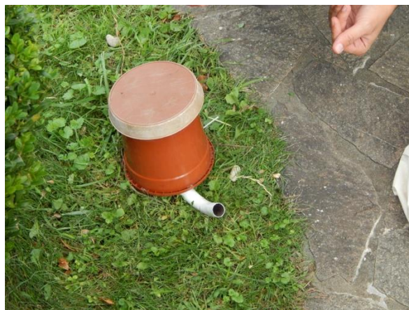
Slika 3: Ustvarjanje habitatov za čmrle v urbanih okoljih – parkih Bohinjske Bistrice.